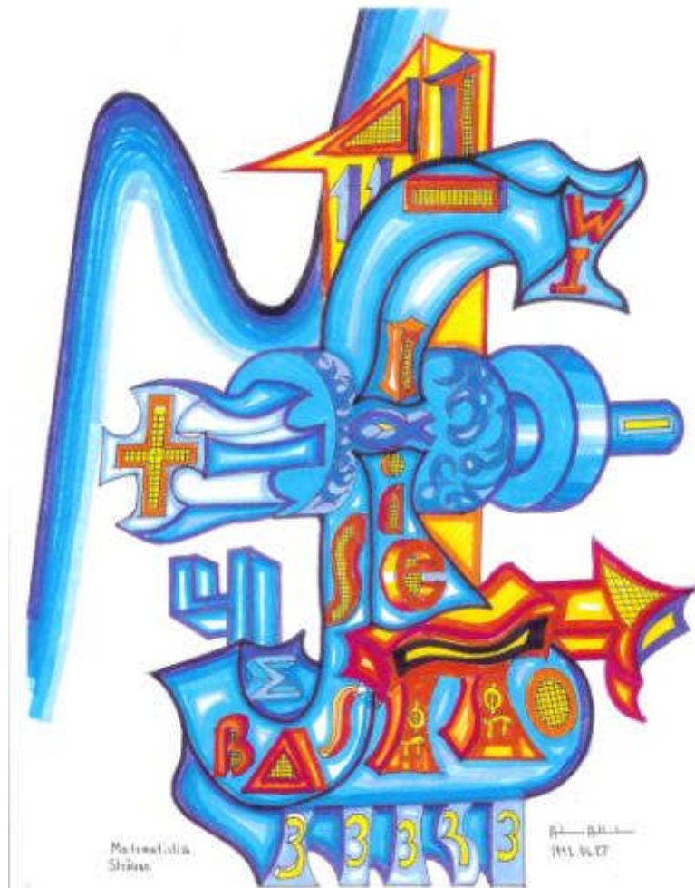
Bild : Avancerad matematik

Civilekonom Snålén funderade en god stund. Han tog sig om hakan, rynkade pannan och krafsade sig i håret. Han tyckte sig se en besparingspotential här!